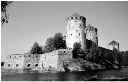
THE OLAVINLINNA CASTLE plays host to the Savonlinna Opera Festival.

Equalling in musical excellence and richness is the Salzburg Festival. Seven operas are on offer this year, with a revival of Roméo et Juliette , with Anna Netrebko but sadly no Rolando Villazon—